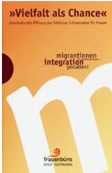
Frauenbüro der Stadt Göttingen

Vielfalt als Chance. Interkulturelle Öffnung der Göttinger Infrastruktur für Frauen