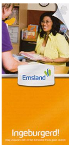
Gleichstellungsbeauftragte Landkreis Emsland

www.neu-wulmstorf.de → Leben, Arbeiten & Wohnen → Bericht der Gleichstellungsbeauftragten über das Integrationsprojekt "Vielfalt vor Ort" (16.02.2011)