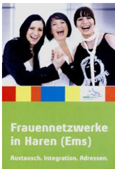
Gleichstellungsbeauftragte Stadt Haren (Ems)

Frauennetzwerke in Haren (Ems) Austausch. Integration. Adressen.