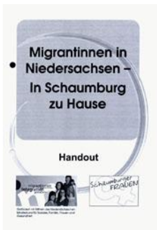
Frauenbüro Landkreis Schaumburg

www.haren.de → Rathaus → Gleichstellungsbeauftragte