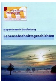
Gemeinde Staufenberg & Gleichstellungsstelle Gemeinde Staufenberg

www.schaumburg.de → Jugend, Soziales, Gesundheit, Frauen → Frauen → Das Gleichstellungsbüro